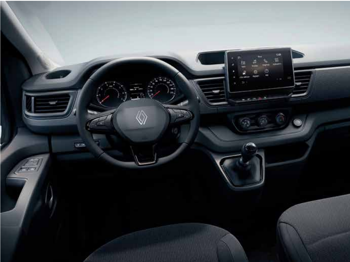
furgón de serie carga o pasajeros